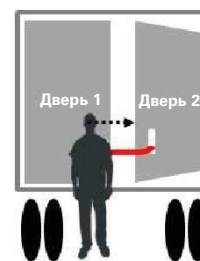
Открыть дверь 2 с прикрепленным ремнем. Проверить наличие наклонного груза ОСТАНОВИТЬ работу, если груз упирается в дверь или наклонен.