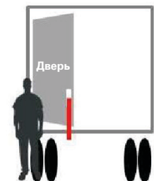
Снять ремень с двери 1. Открыть дверь, потянув на себя, таким образом, чтобы она оставалась между вами и грузовиком. Снять ремень.