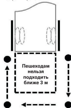
Перейти к другой стороне грузовика, не приближаясь к нему менее чем на 3 м и оставаясь за дверями. Ни в коем случае нельзя подходить вплотную к задней части грузовика, если двери открыты.